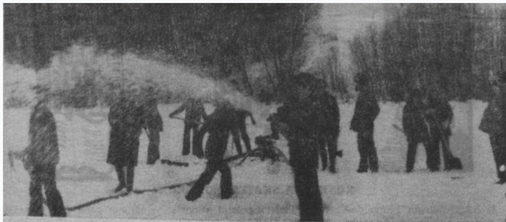
Par skābekli zivīm gādā motorsūknis.