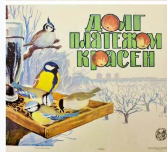
Viskrievijas Dabas aizsardzības biedrības izdotie plakāti no 1969.-1971. gadam